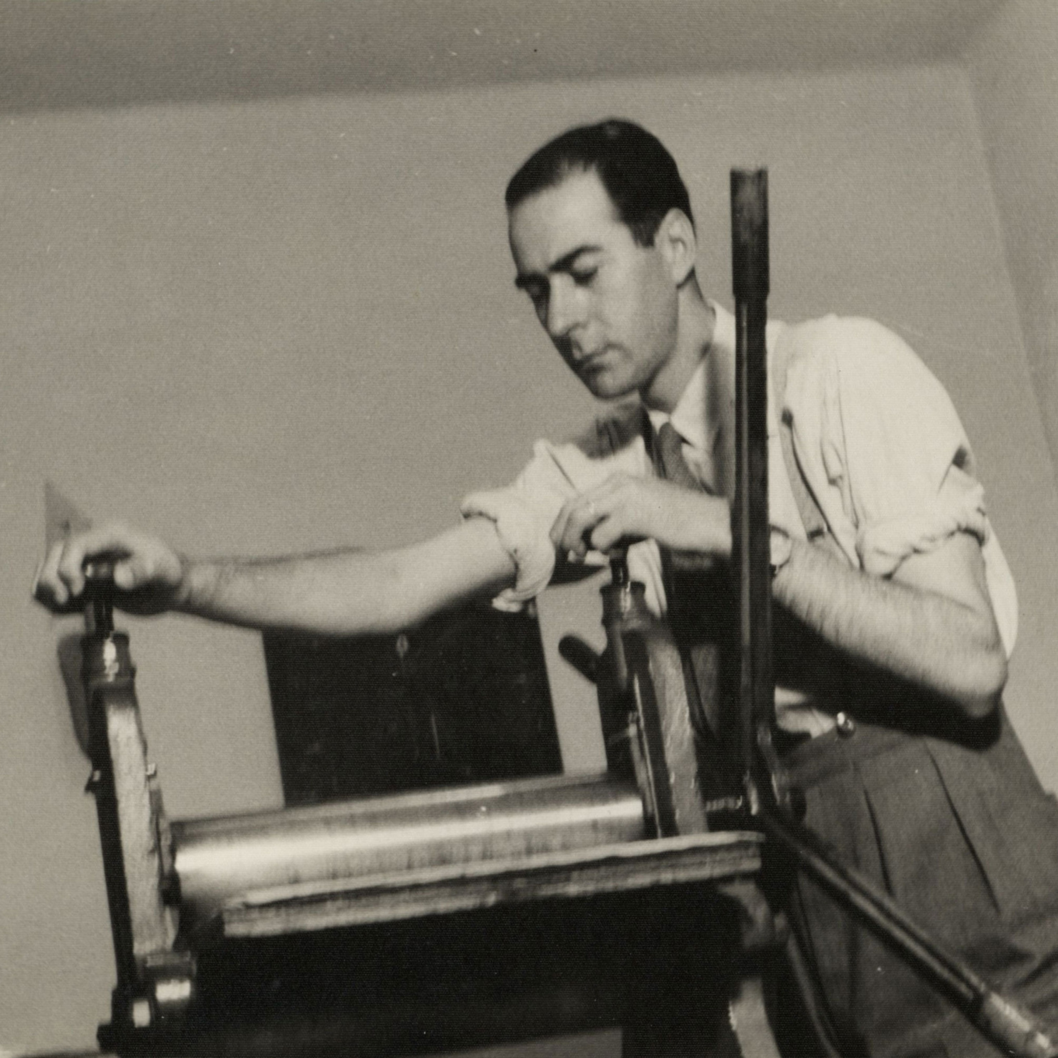
Iberê Camargo imprimindo uma gravura, Rio de Janeiro, 1954